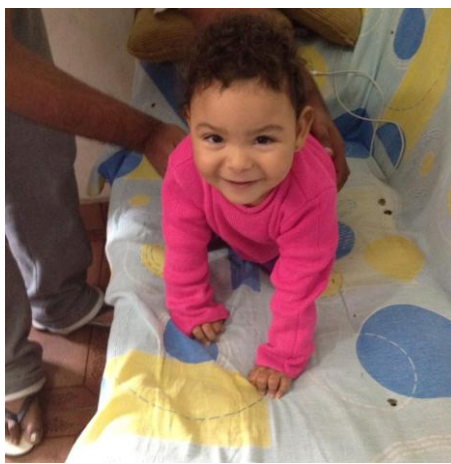
Postura em prono (gato)