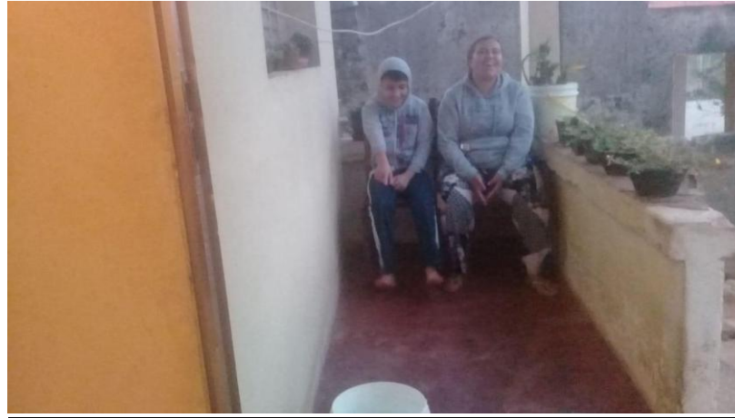
Brincadeira de acerte o alvo