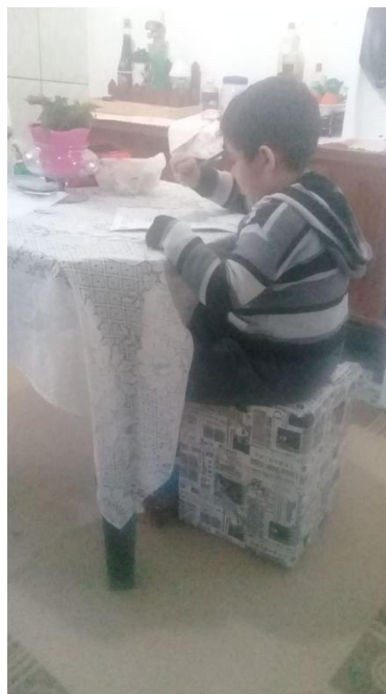
Postura para atividade na posição sentada (antes e depois)